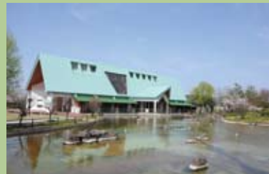
金魚と鯉の郷広場 長洲町は「金魚と鯉のまち」として、全国的にも知られています。いつでも金魚と鯉に触れ合える公園です。