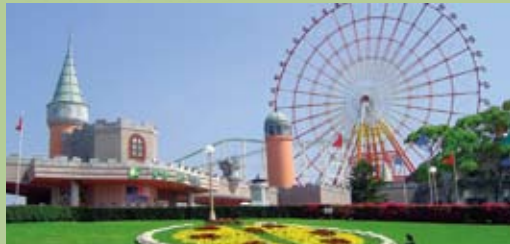
グリーンランド 総面積300万㎡の広大な敷地に遊園地、ゴルフ場、ホテルを併設した西日本最大級のアミューズメントパーク。