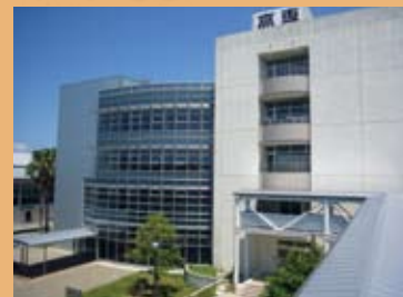
有明工業高等専門学校