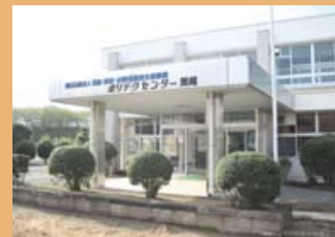
荒尾職業能力開発促進センター