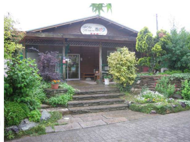
(緑に囲まれた素敵な建物です)