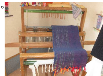
(これがさをり機です)

【交流サロン「ひまわり」】 団体名：NPO法人 菊池ひまわりの会 所在地：菊池市野間口567-4 電話番号 0968-25-5141 FAX 同上 ※菊池地域振興局HPの「縁がわ一覧」もご覧ください