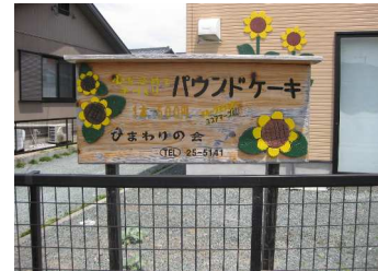
(ひまわりが目印です)