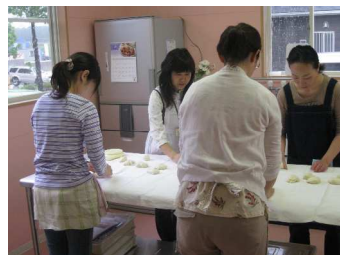
(左から2番目堀理事長)