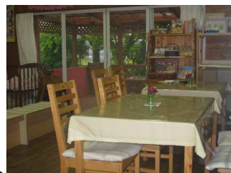
交流(喫茶)スペース