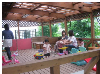
(子育て中のお母さん達も見えられました)