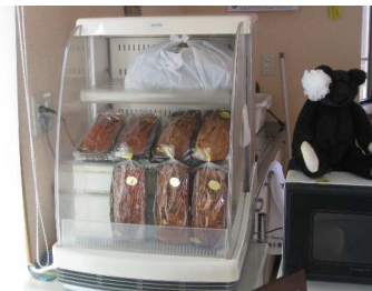
(パウンドケーキ 好評です)