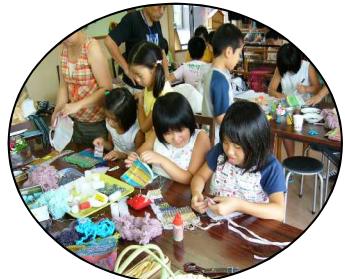
(第1回さをり教室の様様)