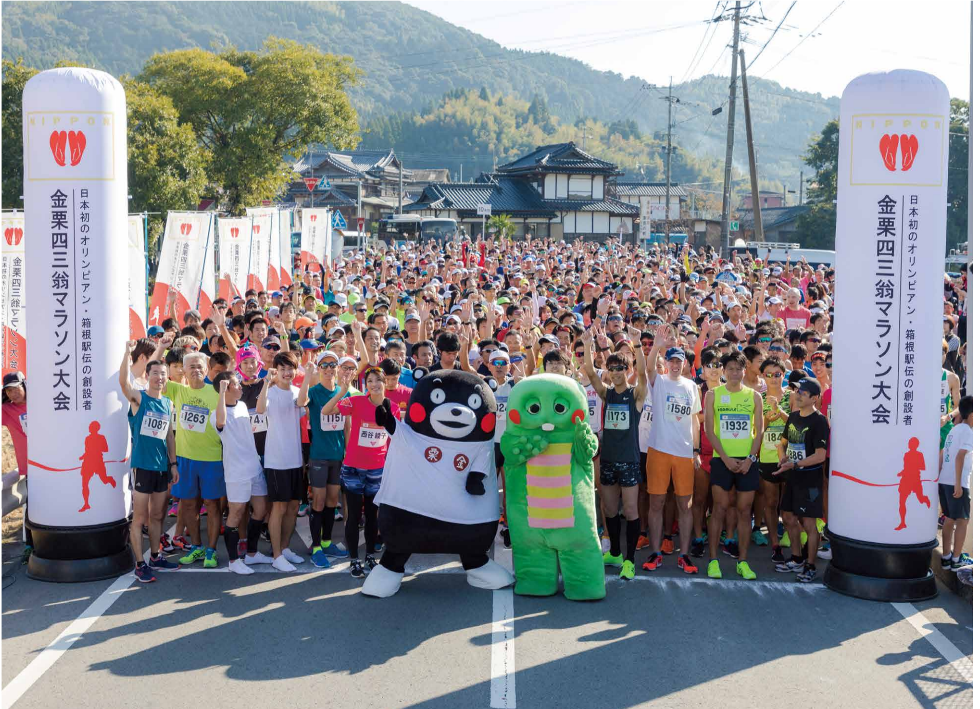
11月4日(日)に、和水町で開催された第35回金栗四三翁マラソン大会。熊本県スポーツ応援特命大使の「くまチャピン」とくまモンも応援に駆け付けました。