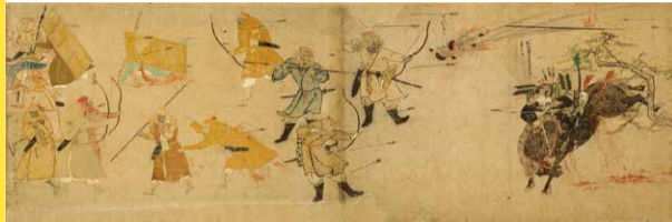
蒙古襲来絵詞(宮内庁三の丸尚蔵館所蔵)

教科書でおなじみの日本の宝「蒙古襲来絵詞」の実物が熊本へ!最新の研究成果とともに展示します。ぜひお越しください! 期間：11月1日(木)～12月17日(月) ※休館日：火曜、11/30 ※会期中に一部展示替えあり 開館時間：9時30分～17時15分 入館料：無料 会場：くまもと文学・歴史館(熊本市中央区出水2-5-1)