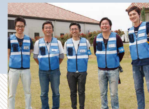
▲益城町の広安小学校区自主防災クラブの皆さん

甚大な被害を受けた益城町 だからこそ、防災の意識を 広めたい。地域のつながり を大切にしながら、「楽しみ ながら備える」ことを伝えて いきたいと思っています。 “避難所初動運営キット” の準備や連絡体制整備な ど、もしもの時に備えてマ ニュアル化を進めていま す。また、地域のイベント に参加して、防災に関心 を持ってもらう活動をし ています。