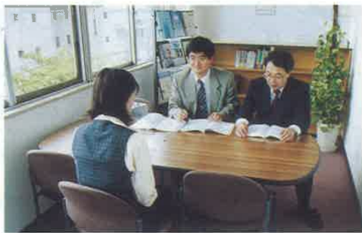
明るく落ち着いた感じの相談室

相談の方法は、電話(フリーダイヤル)と相談室での面談があります。相談室は、明るく落ち着いた部屋でリラックスして相談できそうです。もちろん、相談内容は秘密厳守されます。「匿名でもかまいません。労働に関することならどんな小さなことでも対応します。」との力強いお言葉。費用は、一切無料です。何か悩んでいることや疑問に思っていることがあったら、まずは、お気軽にここ「労働相談情報センター」にお電話してみてください。