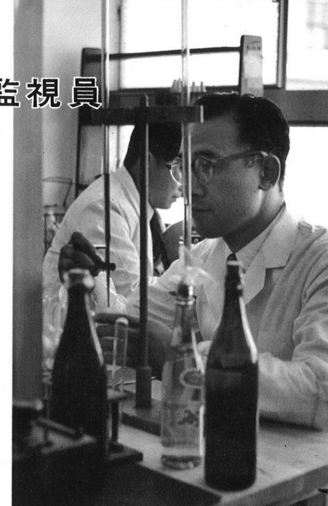
清涼飲料水の抜きうち検査、試験管で細かい分析を 検査指導に出かける前に、その日の計画を打ちあわせる。