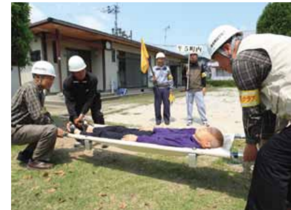
自主防災組織 熊本県自主防災 ●お問い合わせ 危機管理防災課 ☎ 096-333-2811

まずは無理なくできる活動を! 一番大切なことは日ごろからの声掛けなどとおして、地域住民を把握しておくことだと思います。併せて、防災マップの作成などで地域を理解すること、それが安全な時期の迅速な避難誘導につながると思います。また、災害の記憶を風化させないよう、子どもたちに語り継ぐことも大切です。