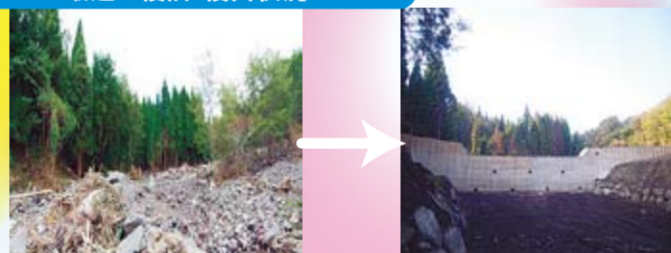
県産木材を使用した型枠による治山施設（阿蘇郡高森町）