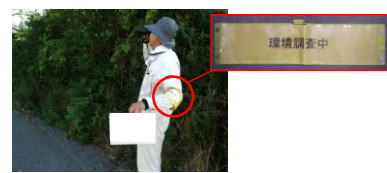
調査員のイメージ