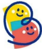
「ぼうさいこくたい」ロゴ「Bちゃん」