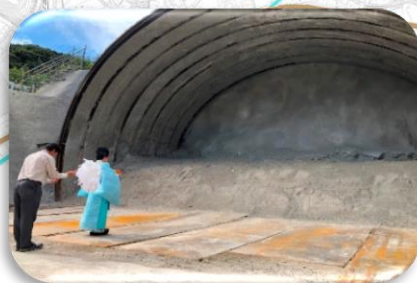
R5.10.2 トンネル安全祈願祭の様子