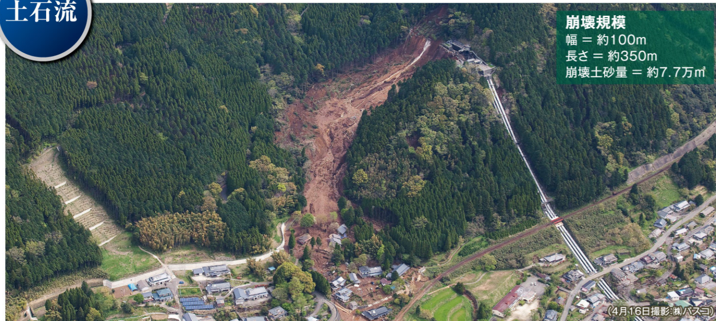
(4月16日撮影(株)バスコ)

崩壊規模 幅 = 約100m 長さ = 約350m 崩壊土砂量 = 約7.7万m 3