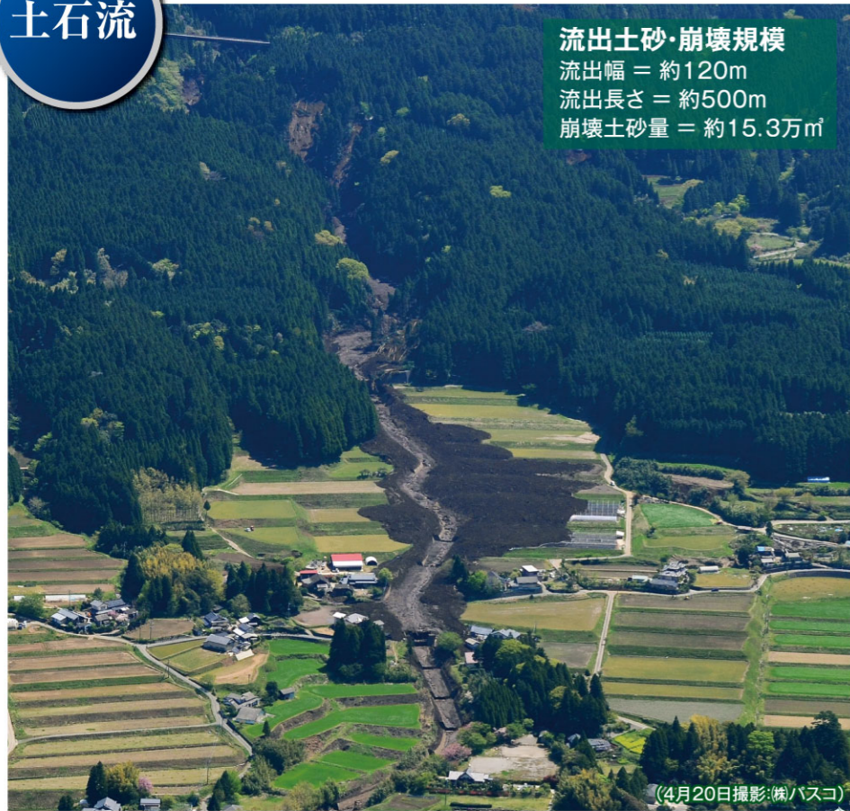
(4月20日撮影(株)バスコ)

流出土砂・崩壊規模 流出幅 = 約120m 流出長さ = 約500m 崩壊土砂量 = 約15.3万m 3