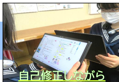
自己修正しながら

教科書本文をリピートしたり、オーバーラッピングしたりして、アクセントやインネーション、語の連結を確認しながら音読