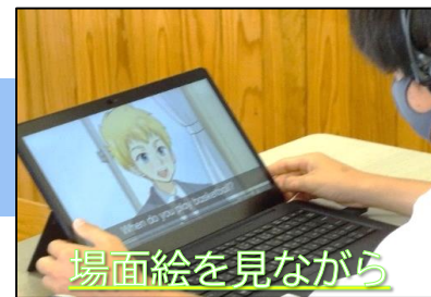
場面絵を見ながら

教科書本文の音声速度を変えたり、スラッシュを入れたり、自分に合ったマスキングの量を調整したりしながら音読