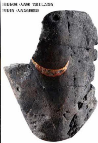
三日月の城（人吉城）で出土した望石 三日月石（人吉文化指定）