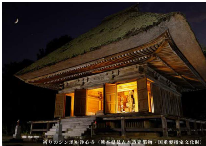
祈りのシンボル浄心寺（熊本県最古木造建築物・国重要指定文化財）