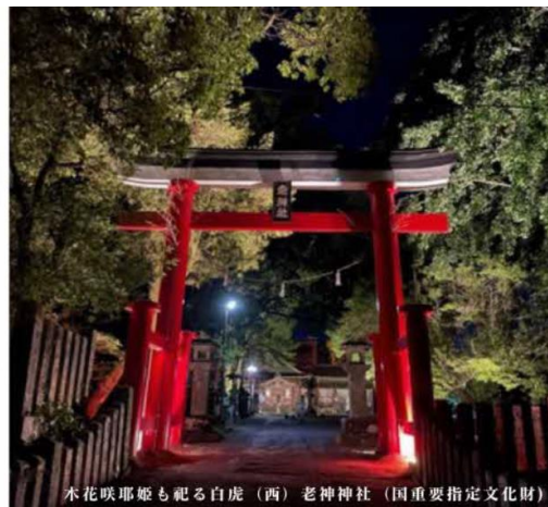
木花咲耶姫も祀る白虎（西）老神神社（国重要指定文化財）