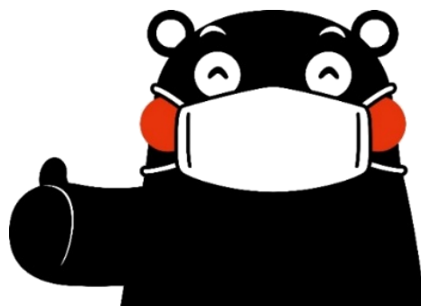
©2010 熊本県 くまモン