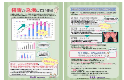
第1～43週の累計報告数(熊本県)

https://www.pref.kumamoto.jp/soshiki/30/152862.html