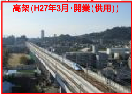
高架(H27年3月・開業(供用))

連続立体交差事業 L II 約6km(鹿兒島本線) 地域高規格道路 熊本西環状線 一般部 約4km 駅部 約2km 豊肥本線 L II 約1km