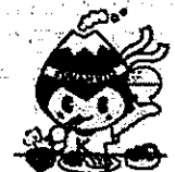
健康が生活習慣くまもと県民運動 キャラクター TISO ぽん太くん

厚生労働省の「スマート・ライフ・プロジェクト」の公式ウェブサイト登録時の印刷用紙の提出 (FAX 又は メール) でも受け付けます。 ただし、「その他の活動を行う」とした場合は、(a) から (g) の取組みの該当記号を余白にご記入ください。