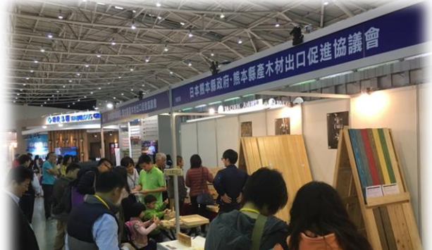
台北ビルディングショーでの県産木材PR(台湾)