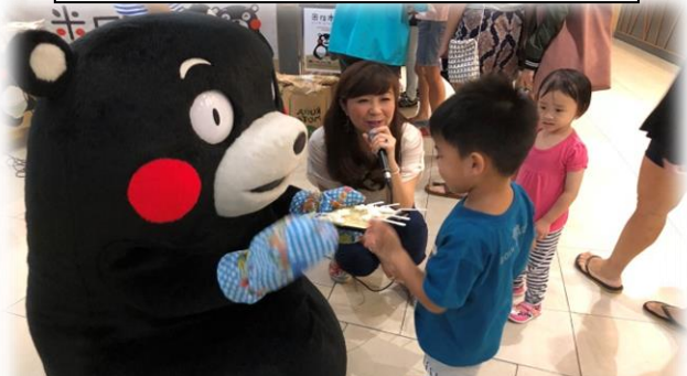
県産米PR(シンガポール)