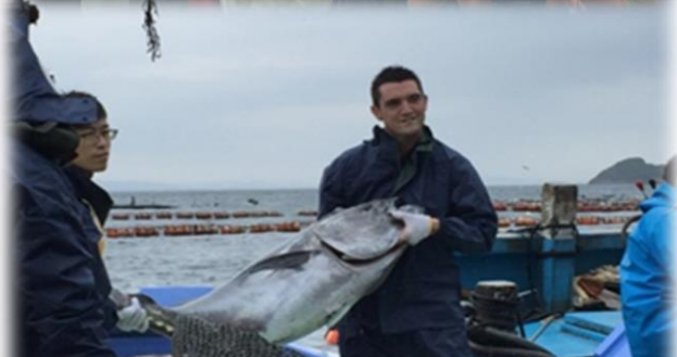
海外バイヤーへの県産水産物PR(香港)