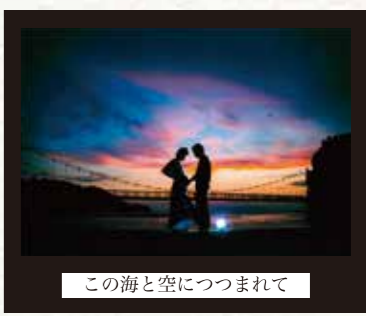
この海と空につつまれて