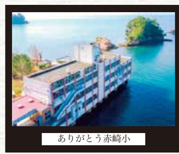
ありがとう赤崎小