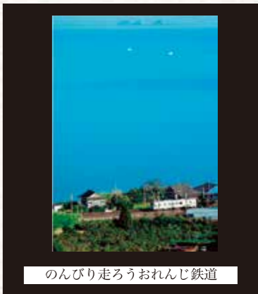
のんびり走ろうおれんじ鉄道