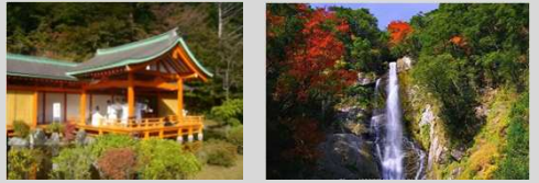
平家の里 五家荘紅葉祭