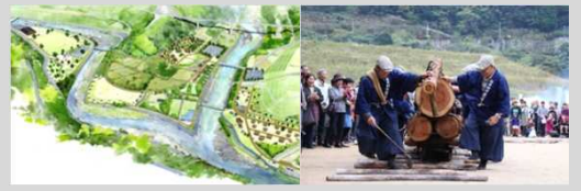
水没予定地の整備 子守唄祭