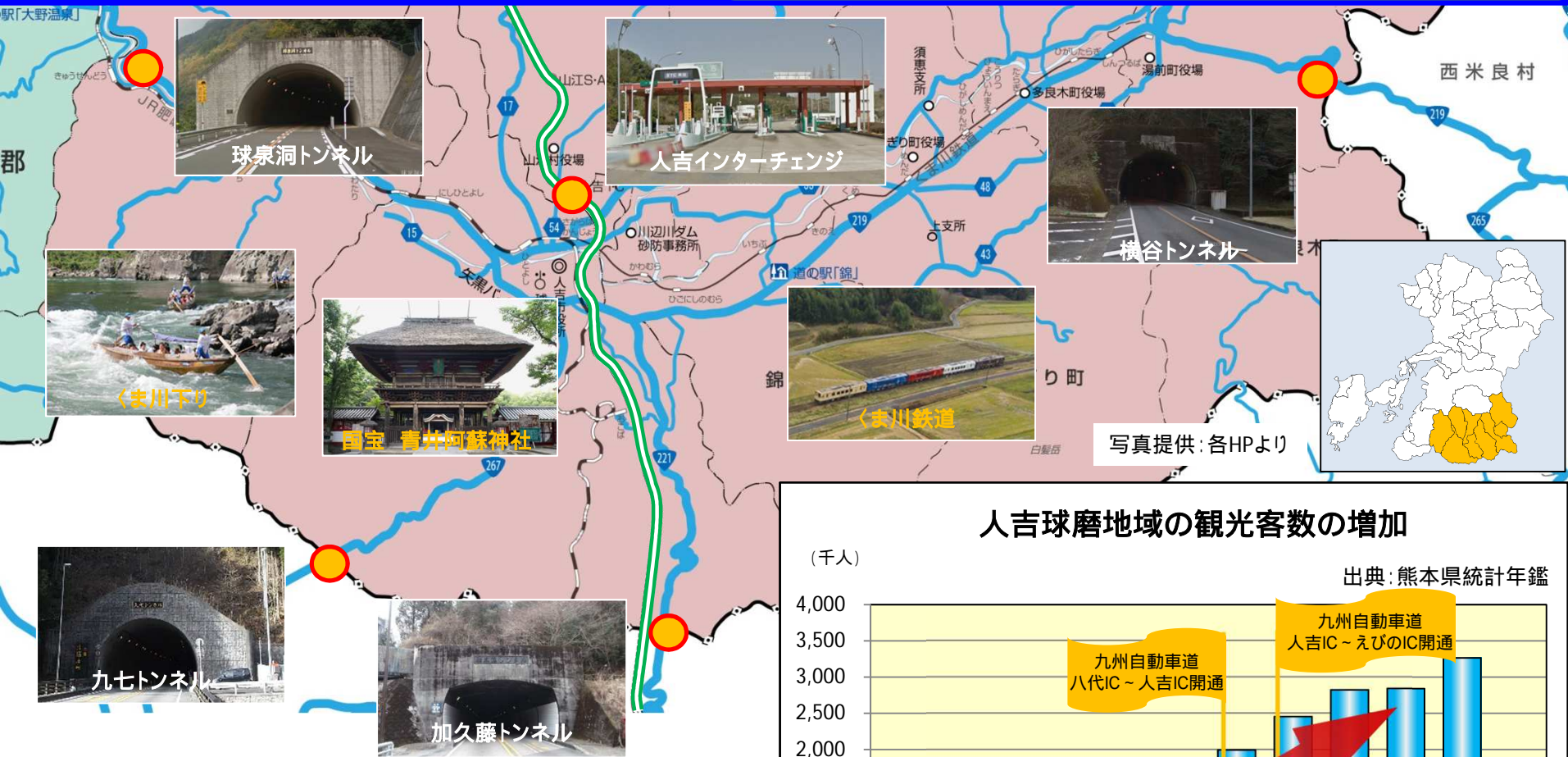
人吉球磨地域の観光客数の増加